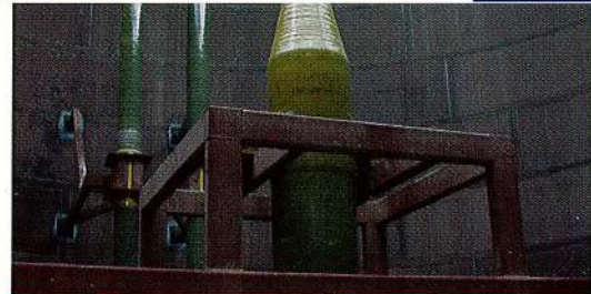
Opvangtank (incl. draagframe) bekleed met Hypalon