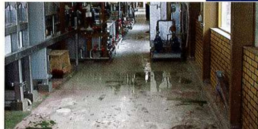
Gietvloer op basis van vinylesterharsen