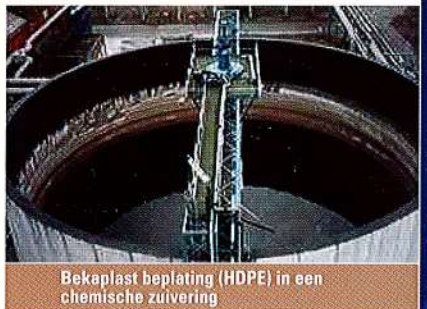
Bekoplast beplating (HDPE) in een chemische zuivering