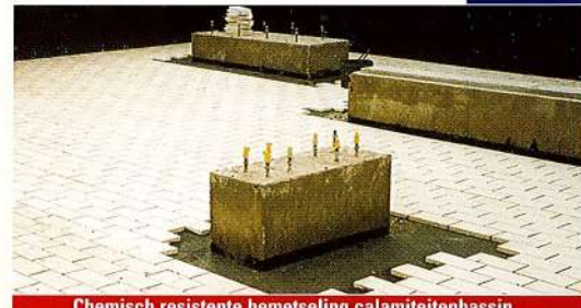
Chemisch resistente bemetseling calamiteitenbassin

PAKOR is leverancier van deze speciale kunststof Bekoplastplaten en is in staat na plaatsing van de kunststofplaten de altijd aanwezige naden op correcte wijze te lassen conform de hiervoor geldende richtlijnen. Hierdoor wordt een volledig vloeistofdichte bekleding verkregen die op dichtheid getest kan worden door bijv. vonktesten.