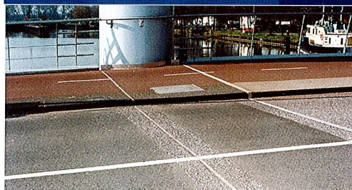
Voegovergang incl. Acme voegenband

Door temperatuurverschillen varieert de afmeting van een betonconstructie. Om verlenging en verkorting mogelijk te maken worden een aantal voegen in de constructie opgenomen. Doordat de voegbreedte door deze beweging niet constant is worden expansieprofielen op de voegen opgenomen. Deze expansieprofielen worden toegepast in overgangsconstructies van bruggen, viaducten en wegdekken almede parkeergarages en tunnel- en ander bouwconstructies die voorzien zijn van expansievoegen. Voegovergangen zijn over het algemeen constructies die onderhevig zijn aan zware mechanische belastingen. De noodzaak voor een goede mortel die geschikt is voor het opvangen van de aanwezige krachten is dan ook van eminent belang. PAKOR levert voor deze specifieke toepassing een mortel die volledig ontwikkeld is voor deze zware omstandigheden. De PAKOR-Rijroostermortel is dusdanig opgebouwd dat het mogelijk is direct na het aanbrengen van de mortel deze te voorzien van het gewenste instrooi-materiaal (Gecalcieneerde Bauxiet, Mandurax etc.). In de loop der jaren zijn dan ook al vele expansievoegen gemaakt met PAKOR-Rijroostermortel. Hierbij zijn de voegen met het alom bekende ACME en VA profiel het meest toegepast.