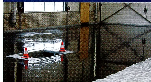
Applicatie PAKOR-Impregneer LF

PAKOR conductieve en dissipatieve vloersystemen zorgen voor een gecontroleerde afvoer van statische elektriciteit. Afhankelijk van het gekozen systeem, bedraagt de elektrische weerstand tussen de 2,5 \times 10^4 \Omega en 1 \times 10^9 \Omega overeenkomstig de eisen zoals deze worden gesteld in NEN-EN 61340-5-1. Ze worden toegepast op plaatsen waar bescherming tegen de gevolgen van statische elektriciteit noodzakelijk is. Het systeem bestaat uit een primer, een hoog geleidende tussenlaag met hierop een geleidende coating of een zelfvloeiende decoratieve afwerklaag. Na applicatie van de PAKOR ESD vloersystemen worden controle metingen uitgevoerd volgens de NEN 1081, NEN-EN 61340-4-1 en NEN-EN 61340-4-5.