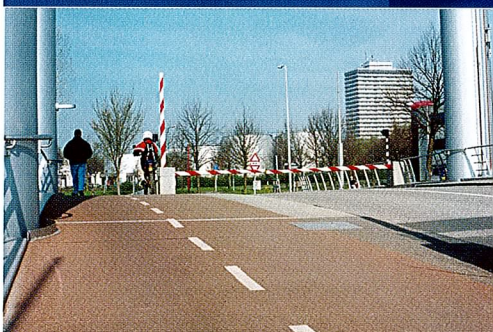
PAKOR-Slijtlaag TV (Fietspaden en stalen hefbrug)