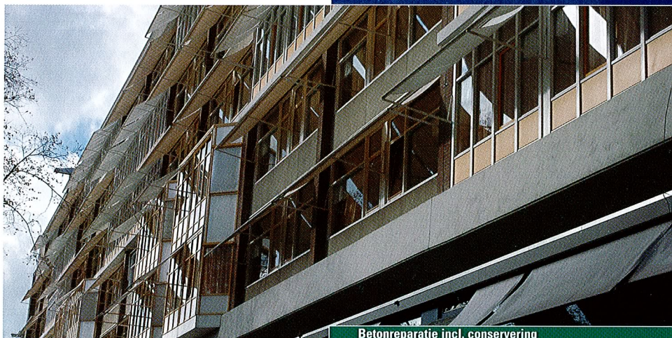
Betonreparatie incl. conservering

Een coating op basis van gemodificeerde wateremulgeerbare epoxyharsen, welke aan de coating dampdoorlatende eigenschappen geven alsmede carbonatatieremmend werken.