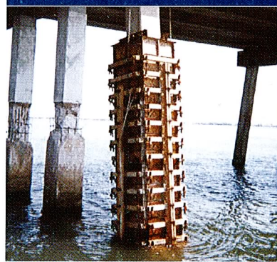
Kolommen aangegoten met PAKOR-Gietmassa